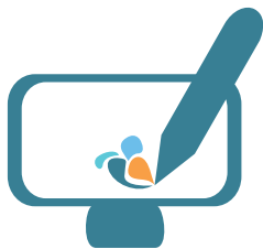
CREACIÓN DE CONTENIDO Y FOTOGRAFÍA